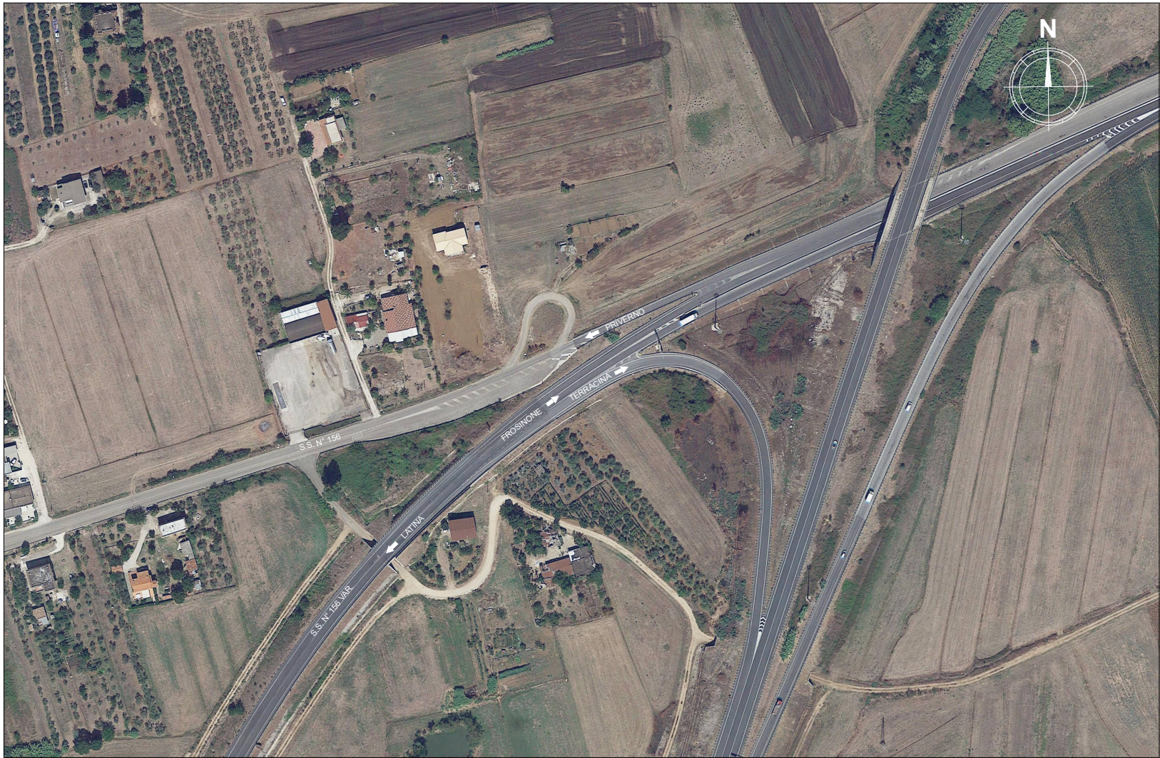
PLANIMETRIA CATASTALE - SCALA 1:1000